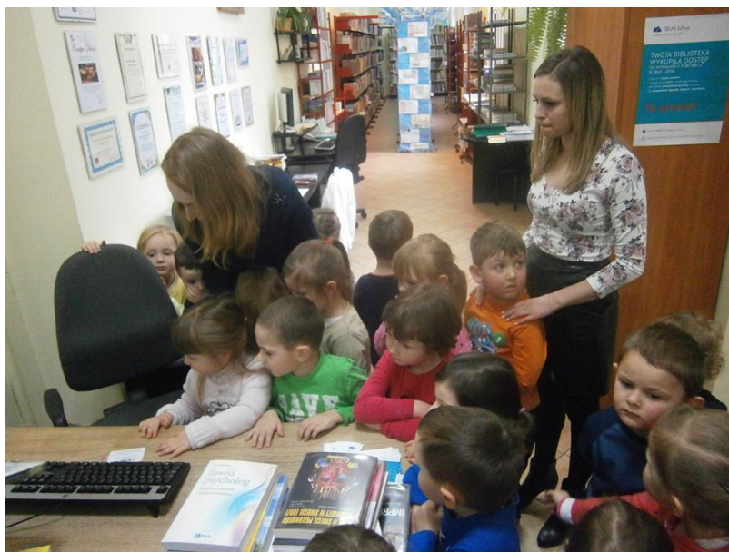
Zdjęcie nr 15

Fot. Zajęcia biblioteczne dla grup przedszkolnych, 2016 rok.