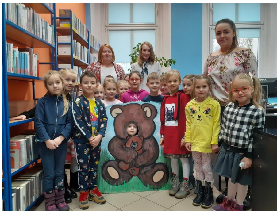
Zdjęcie nr 16