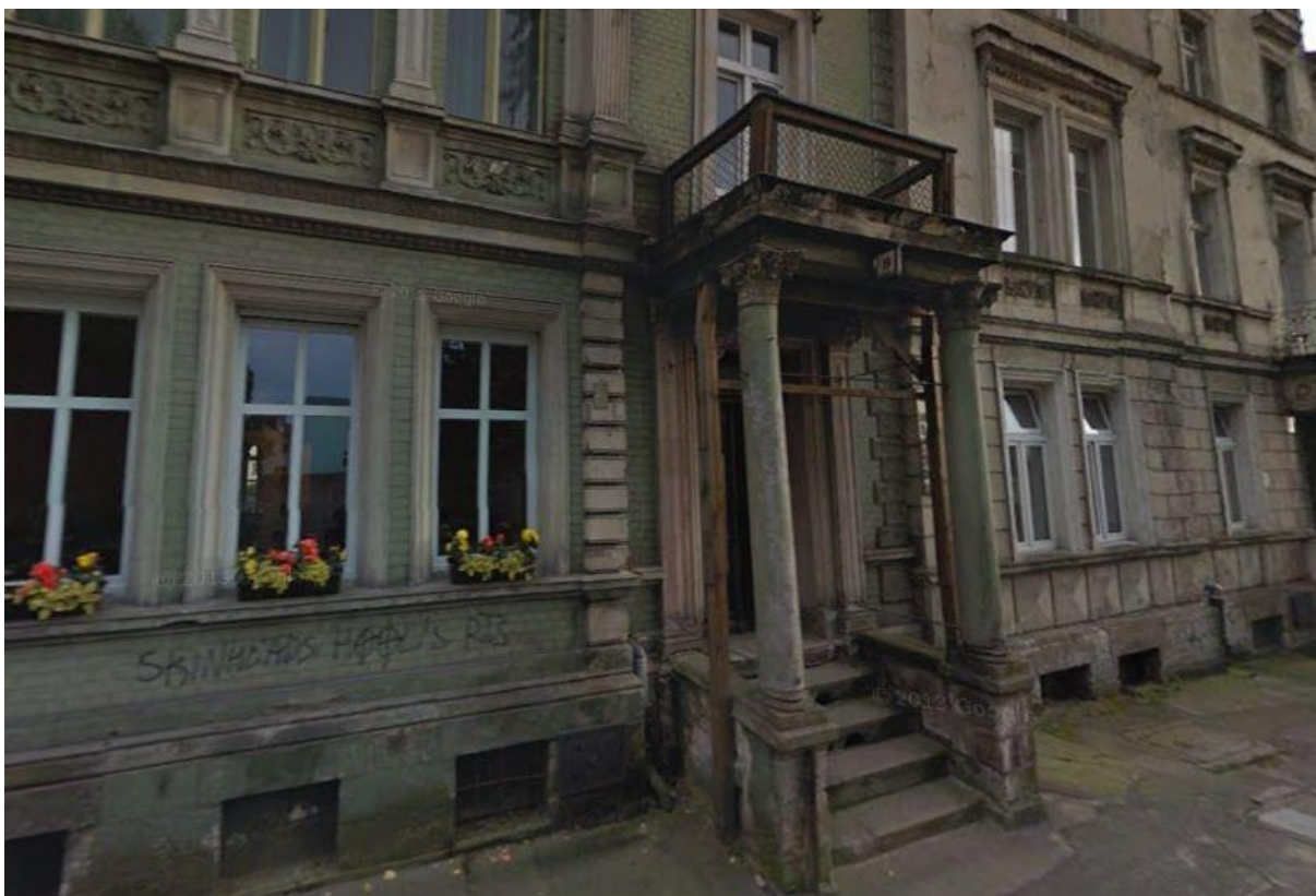
Zdjęcie nr 9

Fot. Lokalizacja Biblioteki przy ul. Bolesława Kubika 9