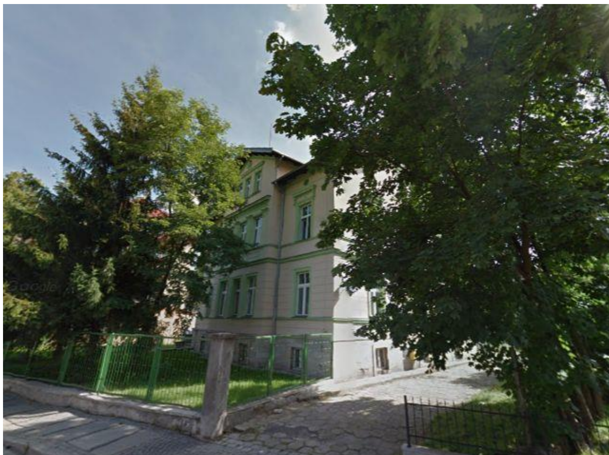
Zdjęcie nr 7

Po dwóch latach Bibliotekę czekała kolejna przeprowadzka. W 1957 roku znalazła nową siedzibę przy ul. Komuny Paryskiej 38 .