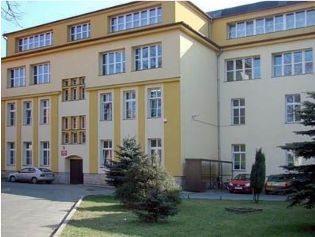
Zdjęcie nr 12

Fot.: Lokalizacja Biblioteki przy ul. H. W. Tyrankiewiczów 11