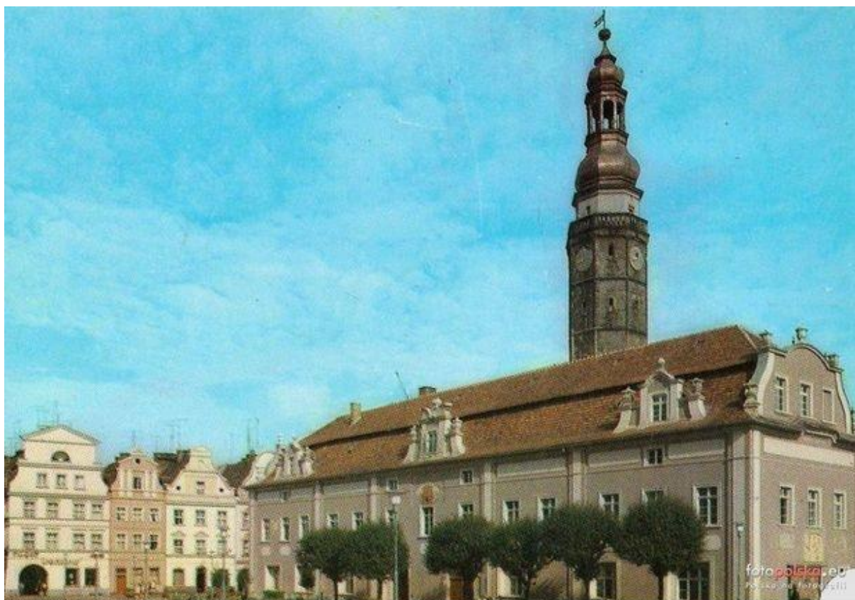
Zdjęcie nr 10

roku otwarto czytelnię czasopism i klub ZNP z liczbą 40 miejsc. Pomieszczenia czytelniane znajdowały się jednak na 2 różnych piętrach, co znacznie utrudniało pracę. Ogólnie, mimo dużej przestrzeni przeznaczonej dla Biblioteki nie można było jej maksymalnie wykorzystać. Podobnie jak w przypadku czytelnicy, największym problemem organizacyjnym stał się teraz rozkład pomieszczeń na różnych piętrach oraz ich niefunkcjonalność.