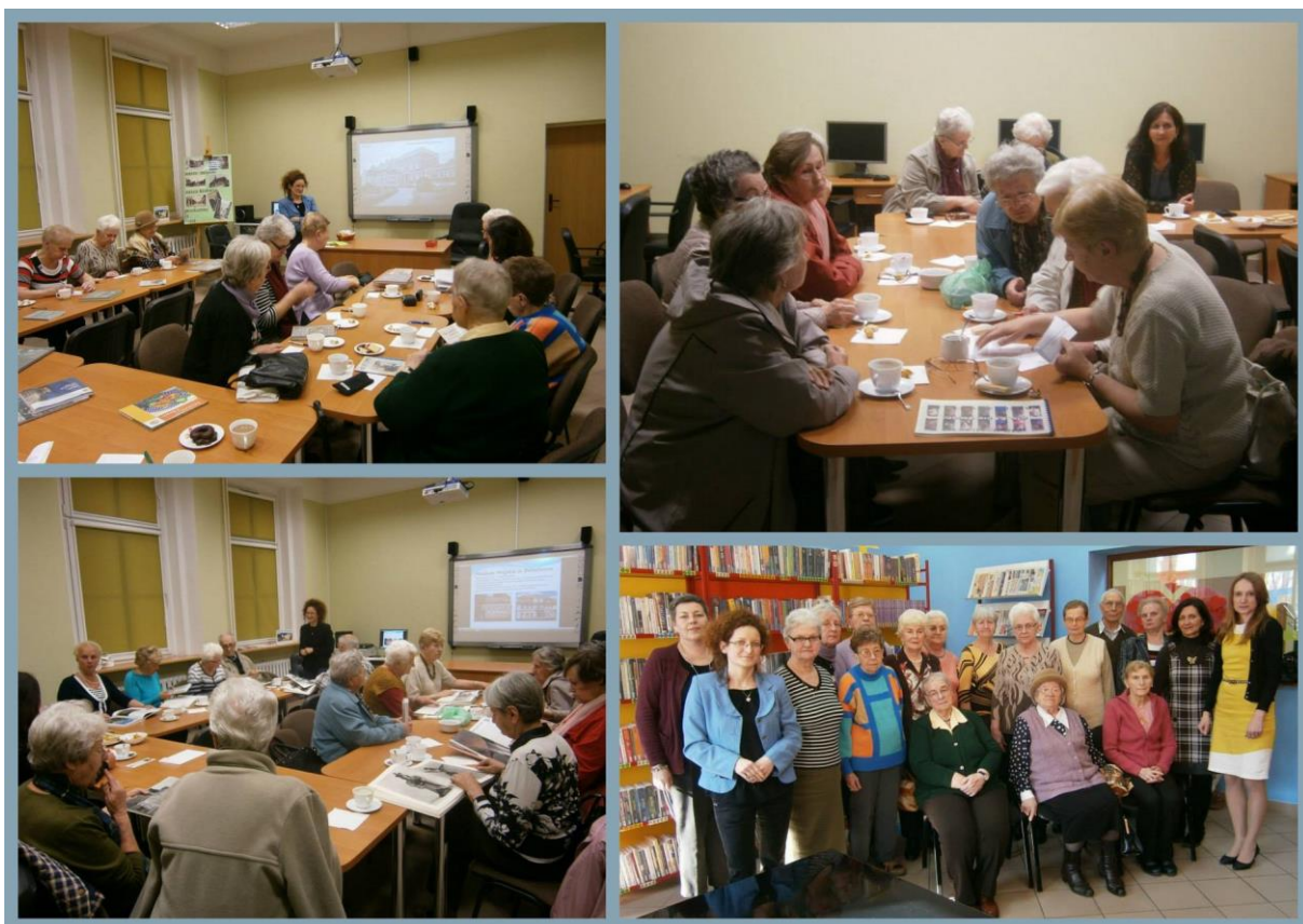
Zdjęcie nr 16

Fot.: Spotkanie z podopiecznymi z Domu Dziennego Pobytu w Bolesławcu