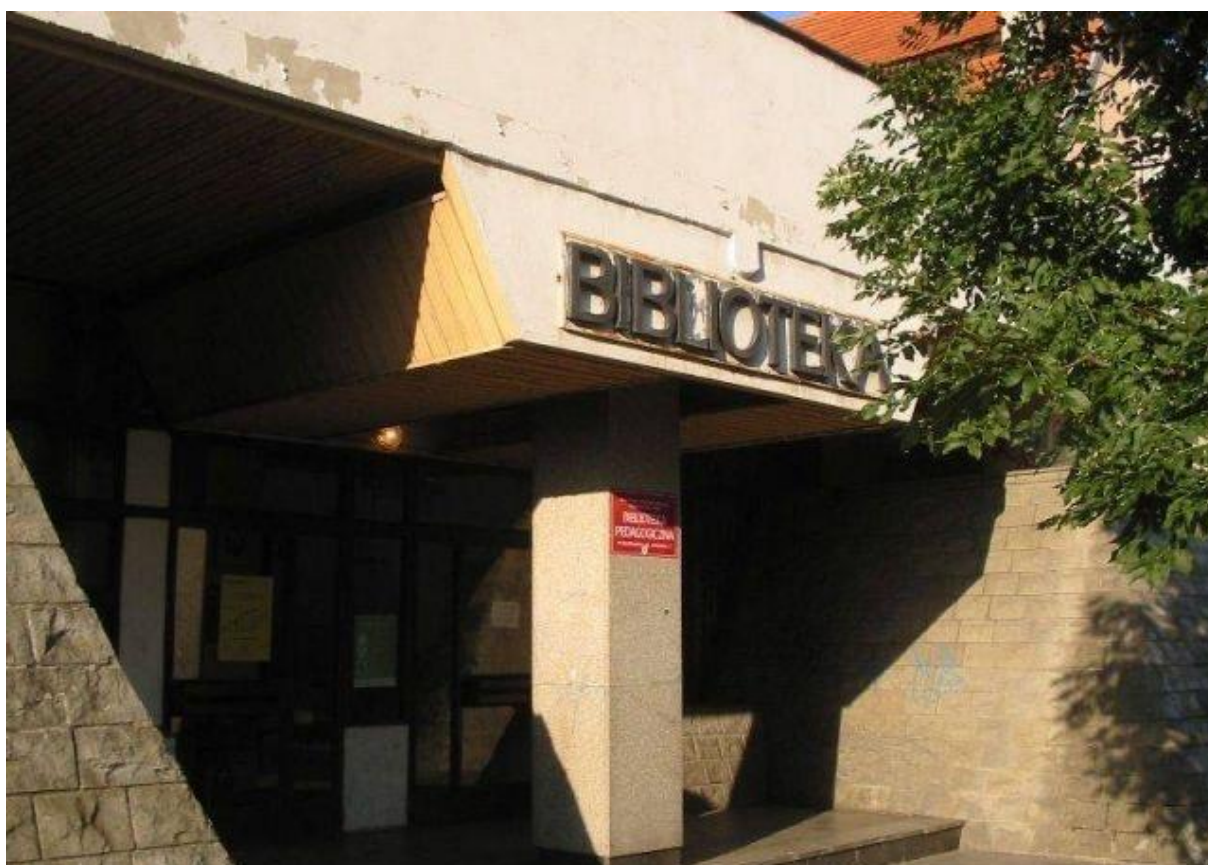
Zdjęcie nr 11

Kolejnej siedziby Biblioteka doczekała się w 1992 roku. Przeznaczono na nią pomieszczenia po byłym Muzeum Kutuzowa ( ul. Michała Kutuzowa 14 ) o powierzchni 280 m 2 .