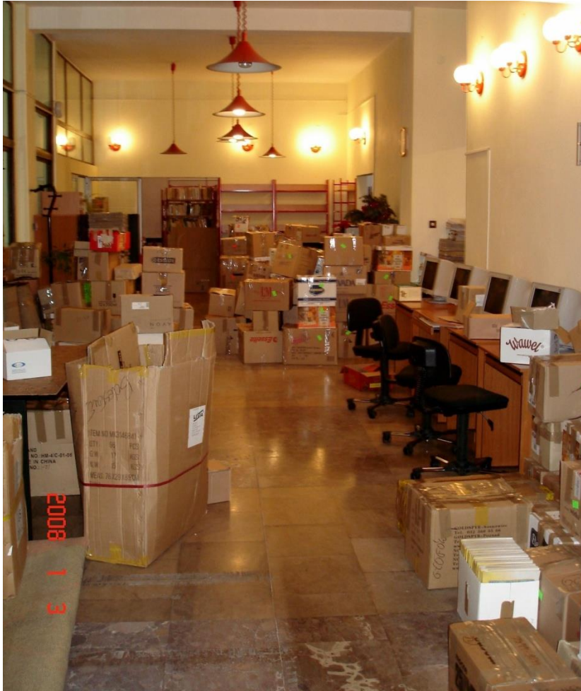
Zdjęcie nr 13