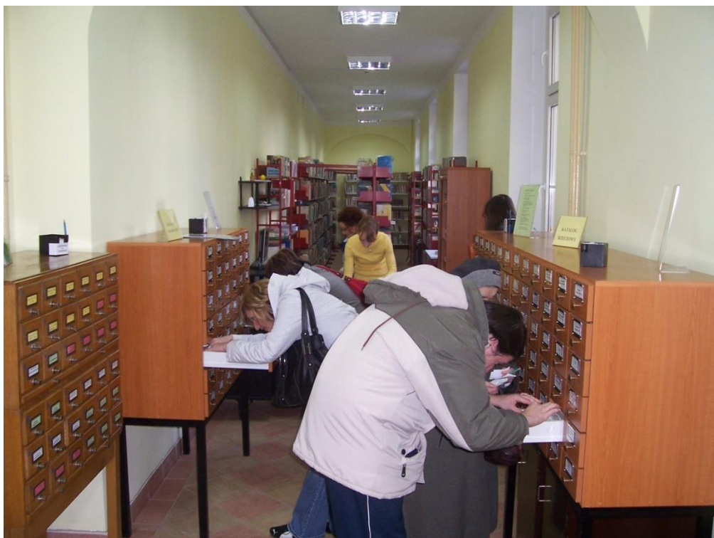
Zdjęcie nr 14

Pierwszy dzień pracy przy ul. H. W. Tyrankiewiczów 11